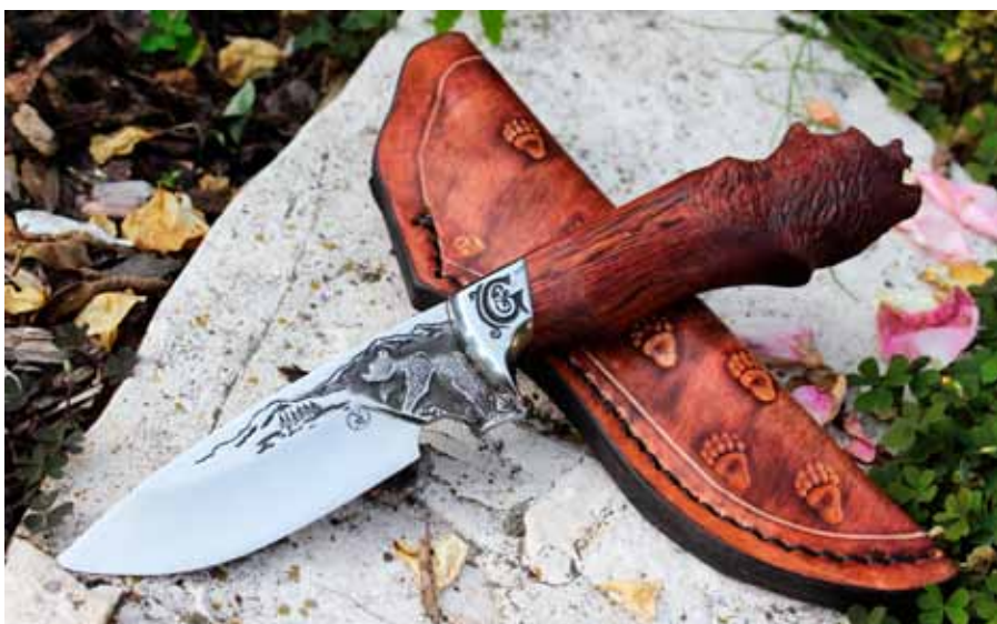
U loveckých nožů se uplatňují zejména přírodní materiály. Zde výrobek Martina Vasila (MV knives) z oceli N690, teakového dřeva a hovězíny