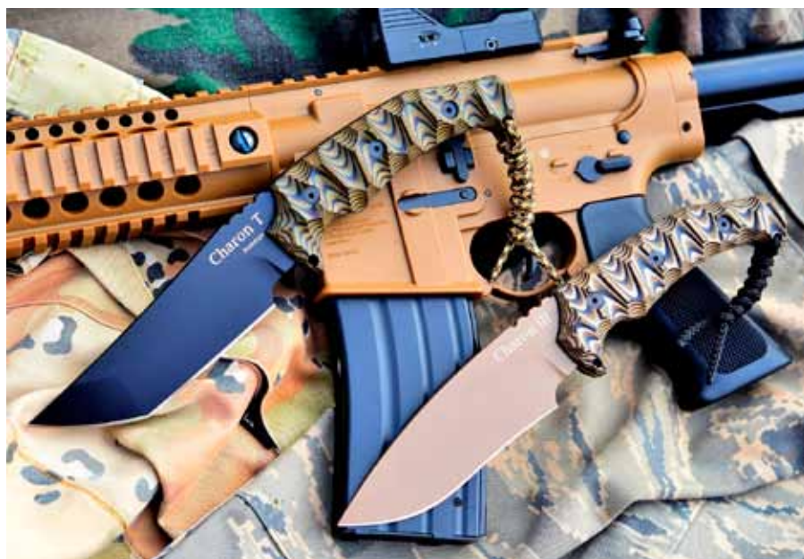
Taktický nůž na míru se dá designově sladit s vaší zbraní – nože Charon od Radima Dachse ( www.dachsknives.com )

i znalci někdy nechají většinu tvůrčí invence na autorovi: „Někdo si řekne o nůž na vandry s čepelí o délce 13 až 16 cm a věci jako design a materiály zkrátka nechá na mně, protože se mu líbí můj styl a těší se na překvápko. Jiní zákazníci donesou okótovanou výkres a do posledního detailu promyšle-