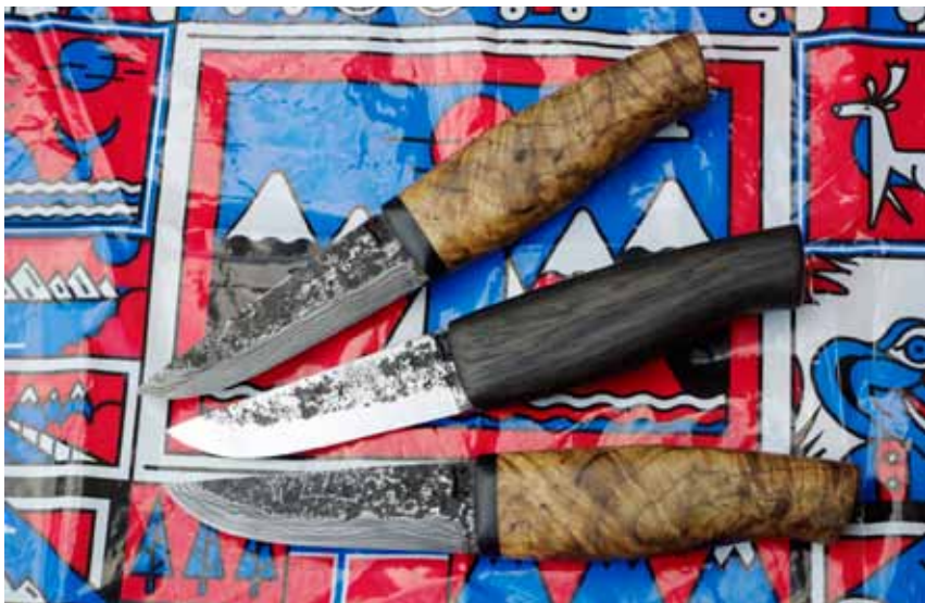
Finské nože jsou kompaktní, libivé i praktické (Jaromír Kotěra)

nespěchá, je obvykle hotovo za pár týdnů až měsíců. Zdeněk Rambousek završí většinu objednávek do dvou až tří měsíců. To Peremštil v Děčíně jsou na práci dva, takže běžně pracují na několika nožích současně. Proto se jim obtížně počítá, kolik času na konkrétním exempláři stráví. Přiznávají, že některé čepele k volné tvorbě čekají v šuplíku na dokončení třeba i rok – ne pro nedostatek času, ale kvůli čekání na ten správný nápad.